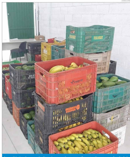
As entidades foram selecionadas por ofertarem alimentação em suas instituições

Além do impacto imediato na segurança alimentar, a execução da ação também passa a servir como referência para a futura implantação do Banco de Alimentos em Pindamonhangaba, contribuindo para a avaliação da oferta de produtos, da logística de distribuição e da viabilidade do programa no município.